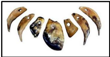
Ожерелье из клыков животных