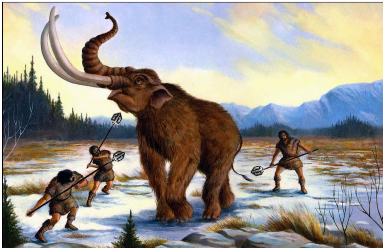
Охота на мамонтов в ледниковый период

По этим находкам археологи постепенно восстановили жизнь людей в глубокой древности. Благодаря археологам, мы смогли узнать, как выглядели древние люди, как они строили жилища, на каких зверей охотились, какую одежду носили, какими орудиями труда пользовались.